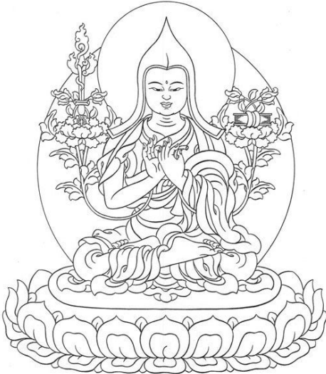
ཙོང་མ་པ་སློབ་མཚན་གྲགས་པ།

དཔལ་ལྷན་ཨ་ཉི་ཤ་རྒྱུ་ཡི་ཀ་ར་བོད་ཡུལ་ ཏུ་ཐེབས་པའི་སྐབས་སུ་ལྷ་སྐྱ་མ་བྱང་ རྒྱལ་འོད་ཀྱིས་ཁོང་ལ་རེ་སྐྱུལ་ཞིག་ལྷུས། དེའི་སྐབས་སུ་བོད་ཀྱི་རྒྱལ་ཁམས་སུ་ དམ་པའི་ཚོས་ལ་ཉམས་ཉེས་ཏེ་ཅང་ ཆེན་པོ་ཕྱིན་ནས་ཚོས་ཡང་དག་པ་བྱེད་ ཤེས་མཁན་ཏེ་ཅང་དཀོན་པོར་གྱུར་ཡོད། སངས་རྒྱས་ཀྱི་གསུང་བཀའ་བསྟན་ རྣམས་བཞུགས་ཡོད་ནས་དེ་དག་སོ་ སོའི་འཚོ་བའི་ནང་ཏུ་ལག་ལེན་རི་ལྟར་